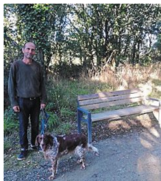
Jacky l'unique banc public.

Pas loin de l'avenue Paul-Paulet, à proximité de la maison de retraite, passe le chemin de randonnée allant de la gare de Pornic longeant la voie ferrée jusqu'au carrefour de la Ria. Ce chemin est très prisé des promeneurs, mais aussi des habitués du quartier ainsi que des résidents de la maison de retraite qui apprécient cette promenade qui apporte verdure et fraîcheur des bois... Sauf que... Se promener c'est bien, mais pouvoir s'asseoir c'est nécessaire. Pas l'ombre