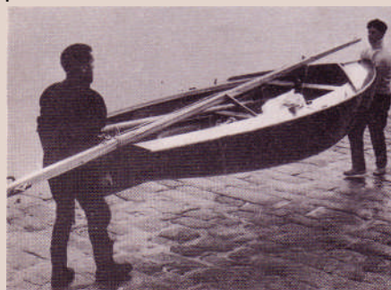
Le Vaurien est transportable par son équipage, mais la coque manque de prises.

Il est facile de remettre le Vaurien dans cette position, mais c'est que le problème se complique.